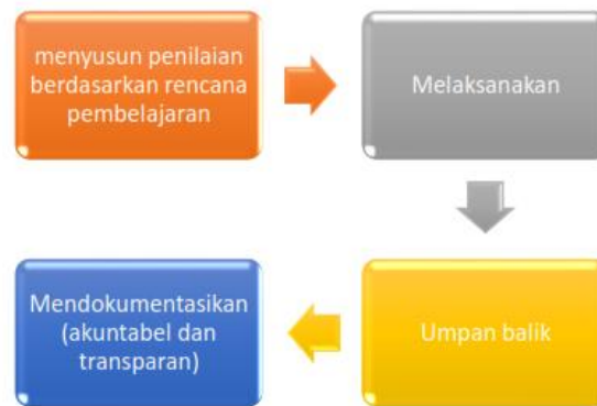
Gambar 1. Mekanisme Pelaksanaan Penilaian

Mekanisme penilaian terdiri dari beberapa tahapan: perencanaan, pelaksanaan, pemberian umpan balik, dan pendokumentasian seperti pada Gambar 1. berikut: